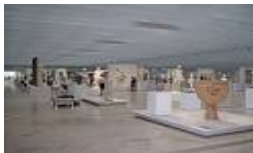
Visite du Louvre-Lens