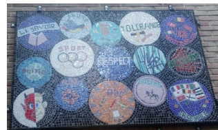
Ecole secondaire Théo Lambert